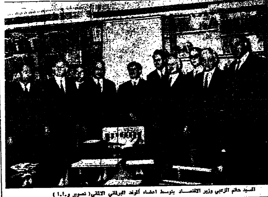
السيد حاتم الزبيبي وزير الاقتصاد يتوسط اعضاء الوفد الاردني الالاتي ( تصوير ١٠٦ )

ارد - قام السيد صلاح العبيدي بمجرد زيارته محافظة اردب زيارته قضاء اقصر . حيث زار مركز الترشيد الزراعي واجتمع بالمركز الزراعي في الحرق وبحث مع الاور المعتمدين في الزراعة وبعد ذلك قام بجولة تفحيفية على جميع المشاريع الزراعية في القضاء واطلع على سير العمل